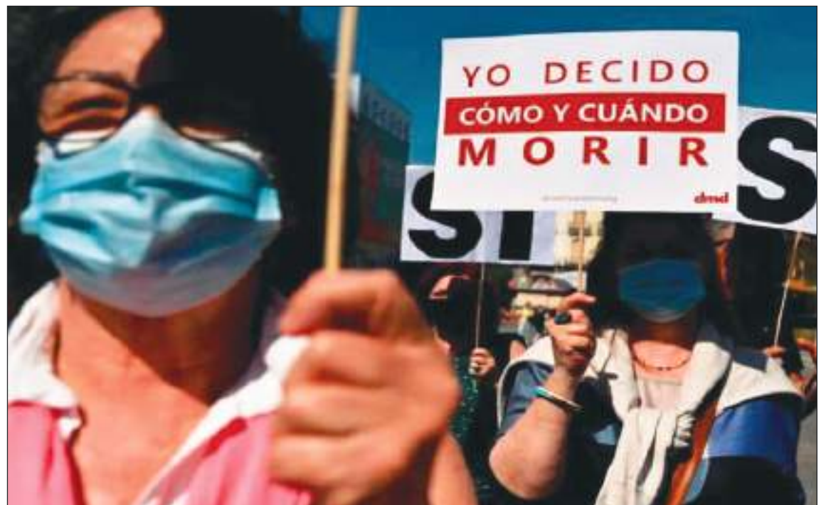
De alguna manera las opiniones siguen divididas en cuanto a la eutanasia.

La esclerosis lateral amiotrófica (ELA) es la forma más común de enfermedad de la