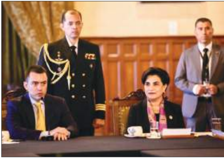
El Presidente Daniel Noboa y la Canciller Gabriela Sommerfeld se reunieron con la comisión que viajó a Quito.

realizó el gobierno ecuatoriano a los Estados Unidos de América, viajó a Quito una comisión de diferentes representantes y organizaciones de apoyo a los migrantes. El TPS beneficiará a miles de compatriotas que no están regularizados migratoriamente en tierras norteamericanas, cuya aprobación beneficiará para que los ciudadanos ecuatorianos puedan acceder a plazas de trabajo sin temor a ser detenidos o deportados.