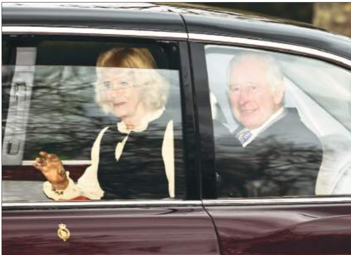
El rey se deja ver en público por primera vez luego de la intervención quirúrgica.

En caso de que sea necesario que alguien lo supla para algunos de sus roles, sólo lo podrán hacer alguno sus siete consejeros de Estado, quienes son la reina consorte Camila; su hijo, el príncipe William; su hijo menor el príncipe Harry; su hermano, el príncipe Andrés; la princesa Beatriz; su hermana, la princesa Ana o el príncipe Eduardo.