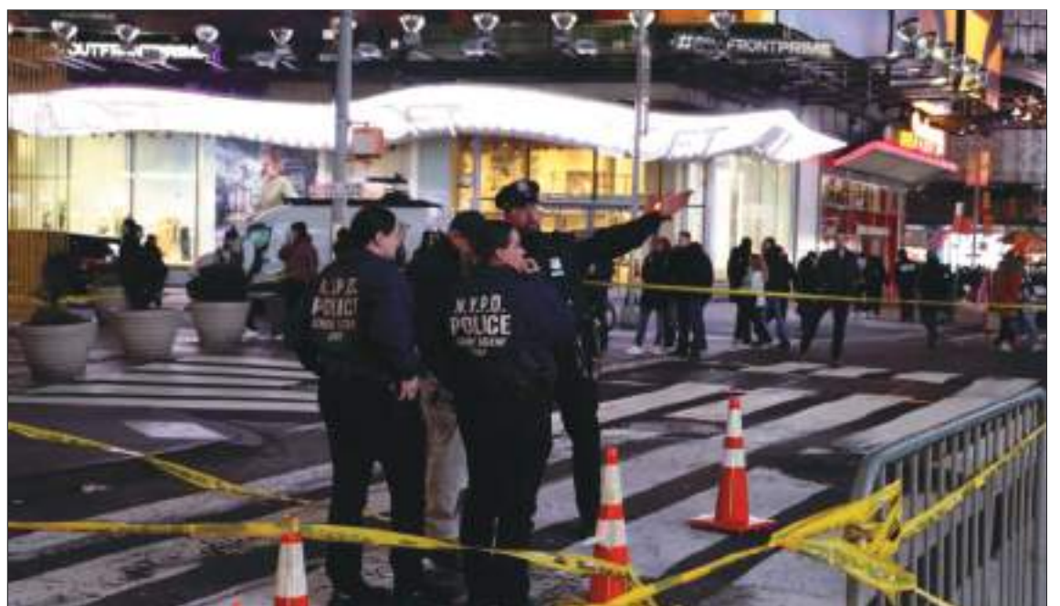
La policía en investigación después de que se presentaron los disparos en Times Square.