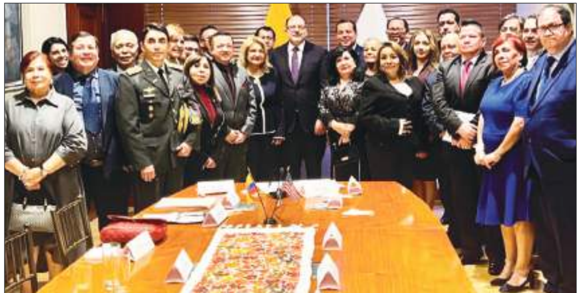
El Presidente de la Asamblea Nacional se reunió con la delegación para tratar varios temas.