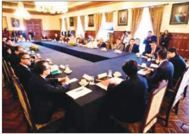
La comisión se reunió en el Palacio Presidencial con el Presidente y la Canciller.