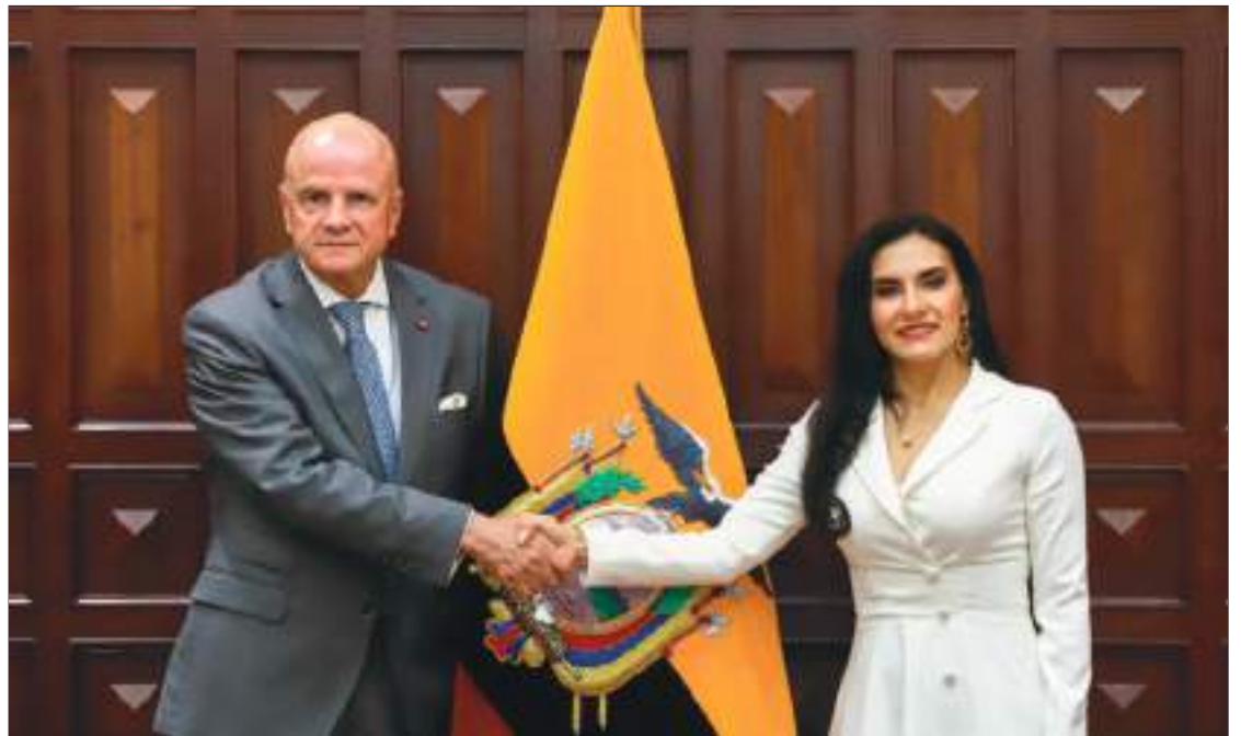
El vicepresidente Alfredo Borrero Vega y la Segunda Mandataria electa, Verónica Abad.

El evento se inició con el Saludo Protocolar del vicepresidente Alfredo Borrero Vega a la Segunda Mandataria electa, Verónica Abad.