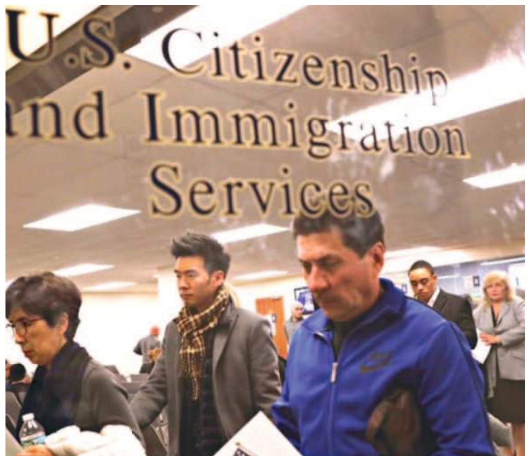
Washington dio a conocer el anuncio de la oficina de migrantes en la región el día después de haber lanzado un nuevo programa de reunificación familiar para migrantes ecuatorianos.

Los centros han recibido algunas críticas por la falta de citas por internet.