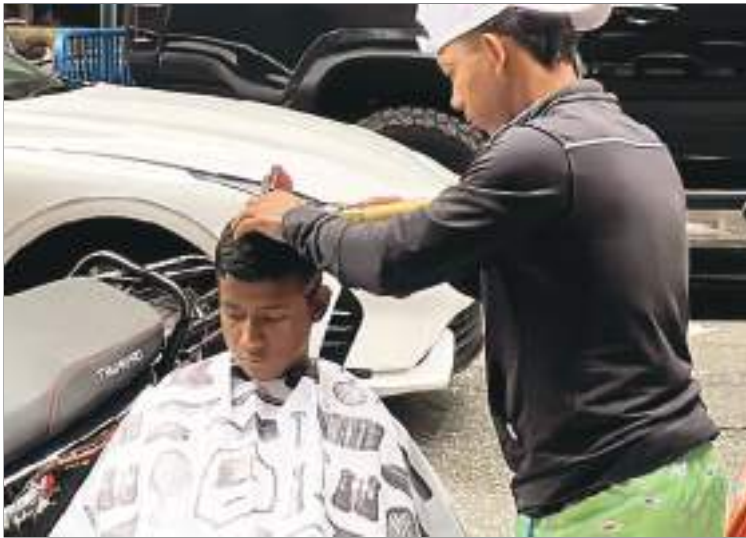
Hasta un peluquero en plena calle encontró trabajo.

a pesar de que no tienen licencia de conducción.