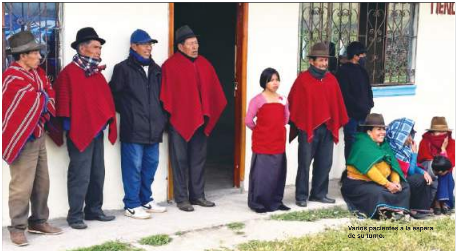
Varios pacientes a la espera de su turno.

Para obtener más información, contáctenos en missionsofmercyww@gmail.com .