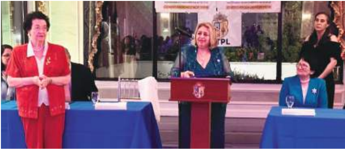
La Hon. Carmen Velásquez Jueza de la Corte Suprema de New York durante su intervención.