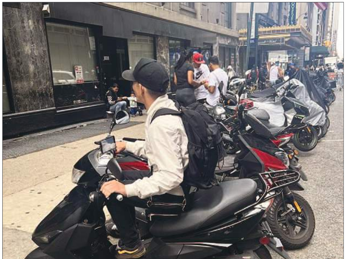
Los que se dedican a repartir comida se sitúan muy cerca.

Las imágenes del lugar mostraron a los manifestantes golpeando las ventanillas del autobús mientras intentaban impedir que los migrantes desembarcaran y entraran al refugio.