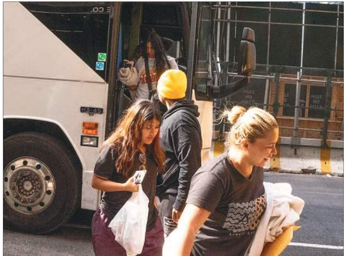
El problema para las finanzas de NY es que siguen llegando, al saber que “aquí los tratan bien”.

ttan, apodada 'la nueva Isla Ellis' por un funcionario de la ciudad, se ha convertido en el punto de registro para los inmigrantes que llegan en autobús a la ciudad después de cruzar la frontera entre