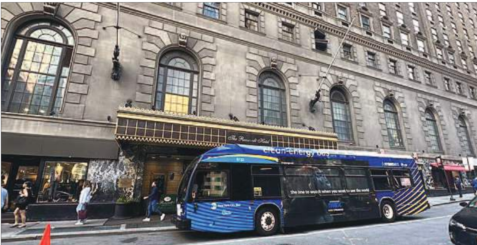
La icónica torre del Hotel Roosevelt en Manhattan, el lugar donde muchos de ellos están alojados. Dicen que “viven como reyes”.