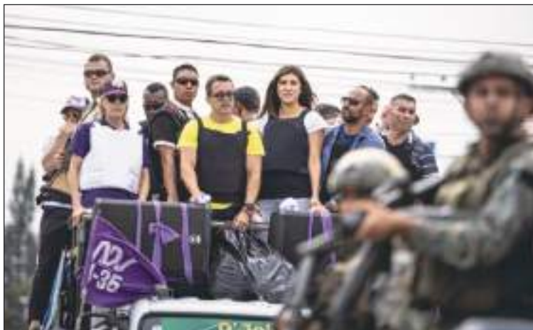
Debido a la situación difícil de Ecuador, Daniel Noboa es uno de los hombres mejor protegidos del mundo. Esta foto fue en la campaña.

Se tiene previsto que a finales de noviembre Daniel Noboa asuma lo que será un mandato muy corto. ¿Será que cumple lo de las barcasas?