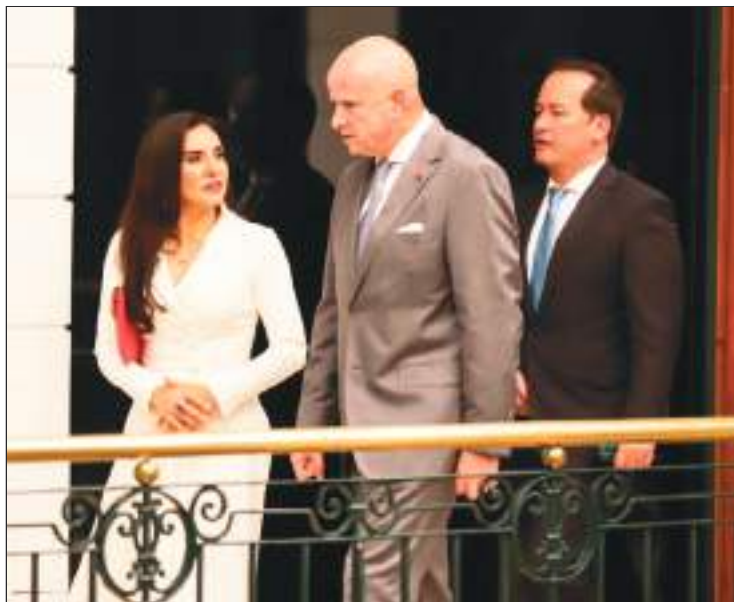
Verónica Abad, Vicepresidenta electa, Alfredo Borrero, Vicepresidente actual y El ministro de Gobierno, Henry Cucalón.

Por su parte, la Segunda Mandataria electa, Verónica Abad expresó su agradecimiento al pueblo ecuatoriano por confiar en la propuesta de gobierno del presidente electo Daniel Noboa. "Tenemos un equipo multidisciplinario, mujeres destacadas y un equipo legal para hacer una transición correcta. Tendrán una vicepresidenta en territorio para tender los puentes que requiere el Ecuador", afirmó.