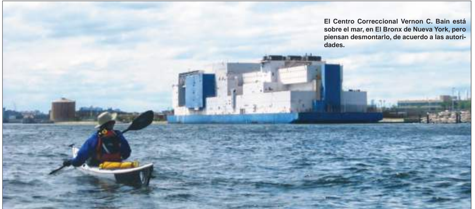
El Centro Correccional Vernon C. Bain está sobre el mar, en El Bronx de Nueva York, pero piensan desmontarlo, de acuerdo a las autoridades.

Gran parte de la ola de criminalidad surge del uso de las