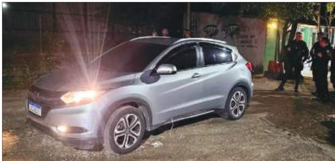
El auto en que se movilizaban los dos narcos asesinados tras haber cometido un terrible error.