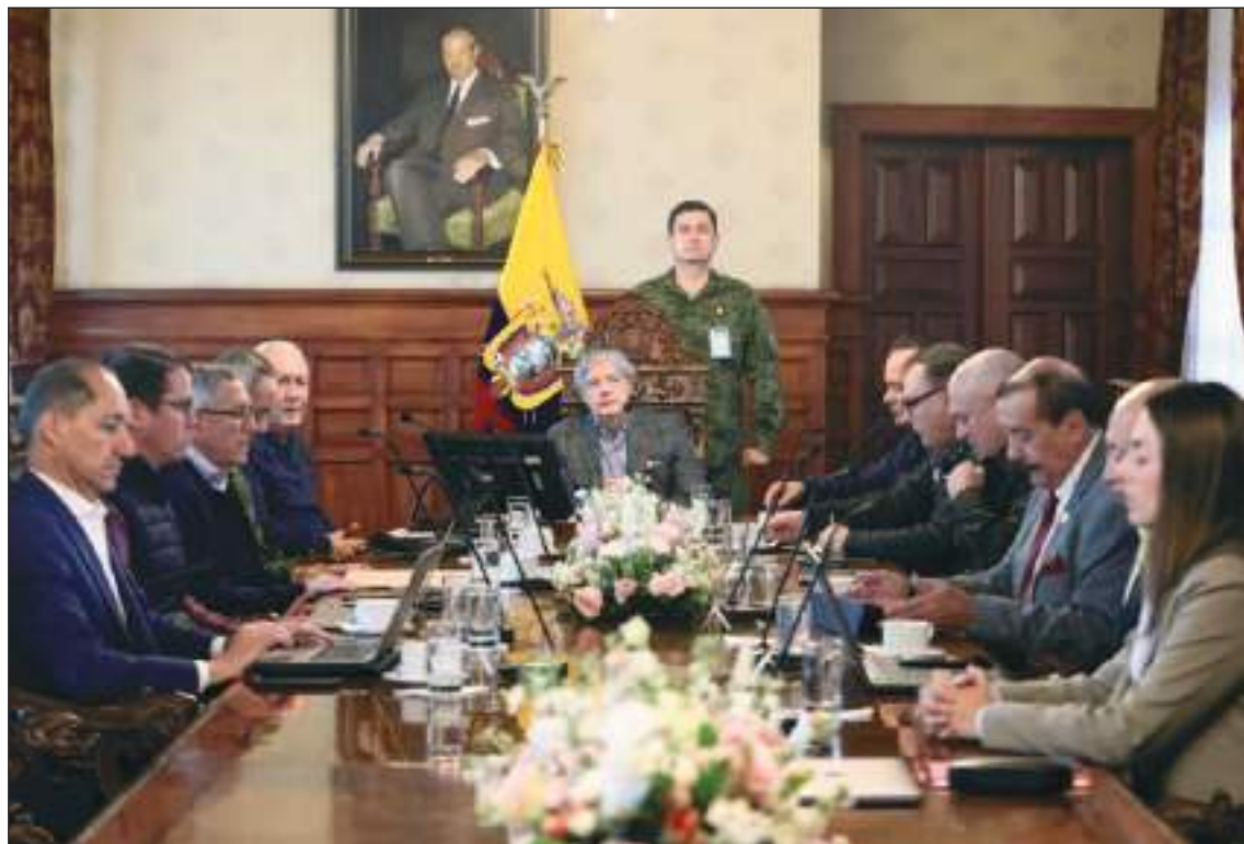
El presidente Guillermo Lasso se encontraba en Nueva York por motivos personales y tenía previsto iniciar desde aquí un viaje a Corea, plan que debió cancelar por la gravedad de lo ocurrido. Lo primero que hizo fue separar de su cargo a varias autoridades de la policía y de prisiones.