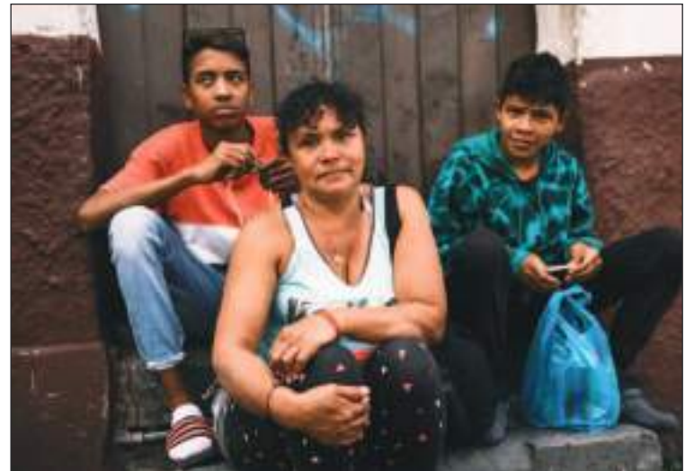
Una de las familias que habló con el Alcalde de NY.