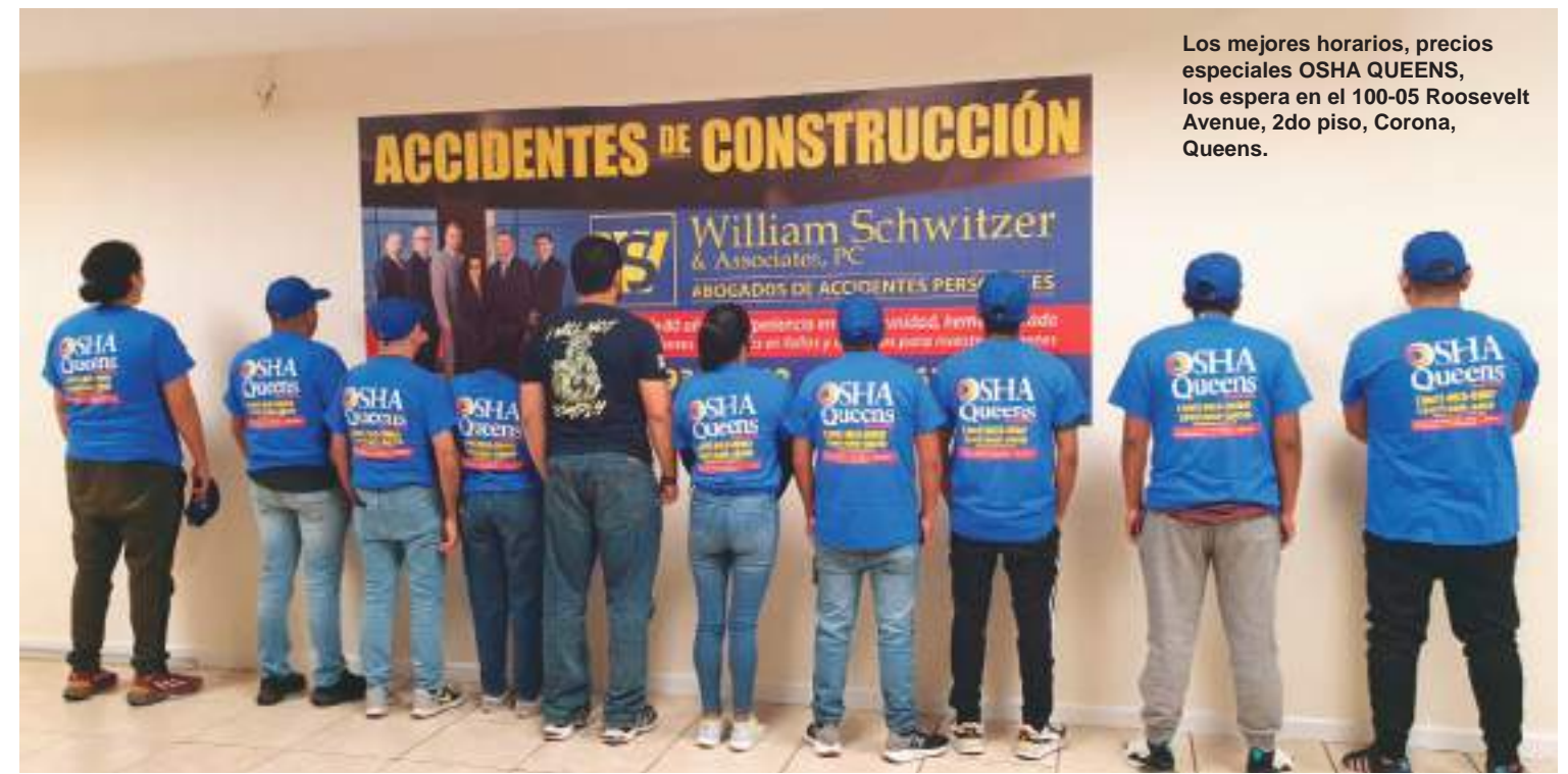
Los mejores horarios, precios especiales OSHA QUEENS, los espera en el 100-05 Roosevelt Avenue, 2do piso, Corona, Queens.

nuestros trabajadores de la construcción en todas sus necesidades y requerimientos, porque nos preocupamos por su bienestar y estamos con Uds. para servirlos con esmero, respeto y eficiencia.