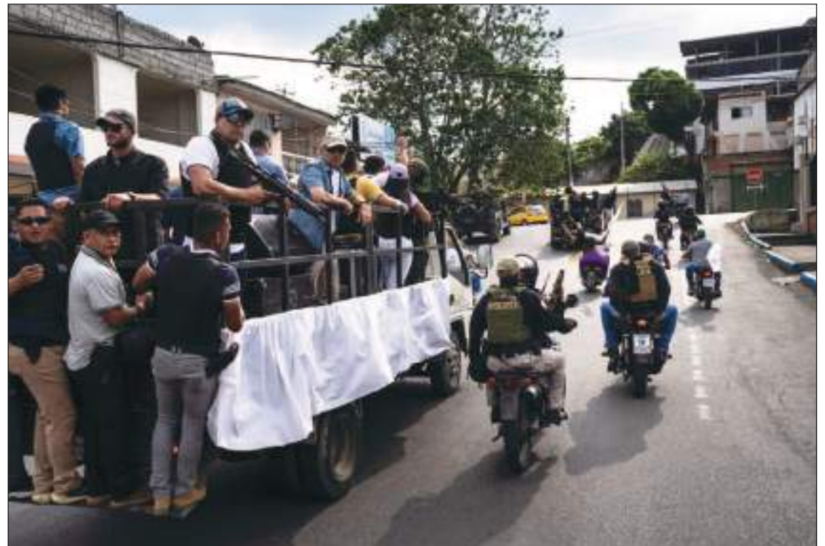
El hecho mantiene en tensión total estos días prelectorales.