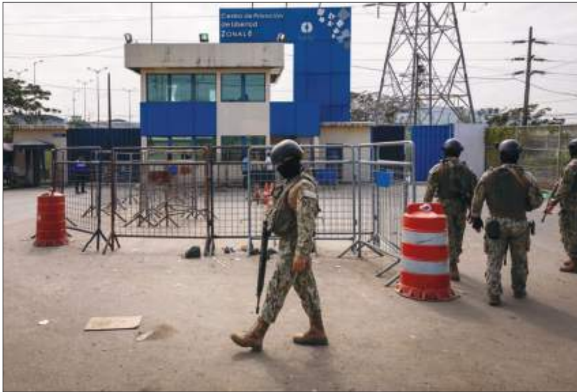
La prisión de Guayaquil donde se produjo el múltiple crimen de los sindicatos del magnicidio.