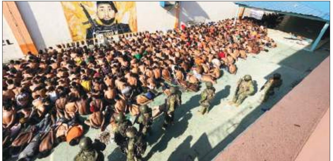
Los mismos presos ecuatorianos están aterrizados por lo que sucede.

En una de ellas, la regional de Guayaquil, cercana a la Penitenciaría, está recluido Adolfo Macías, alias "Fito" y capo de una banda con nexos con un cartel de las drogas mexicano, que fue identificado por el ex presidente Villavicencio como el autor de amenazas contra su vida y la de su equipo de campaña.