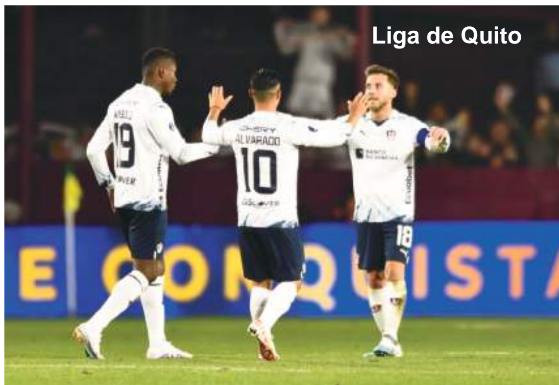
Liga de Quito

El Estadio Domingo Burgueño Miguel, con capacidad para 20.000 espectadores, está a más de 5.000