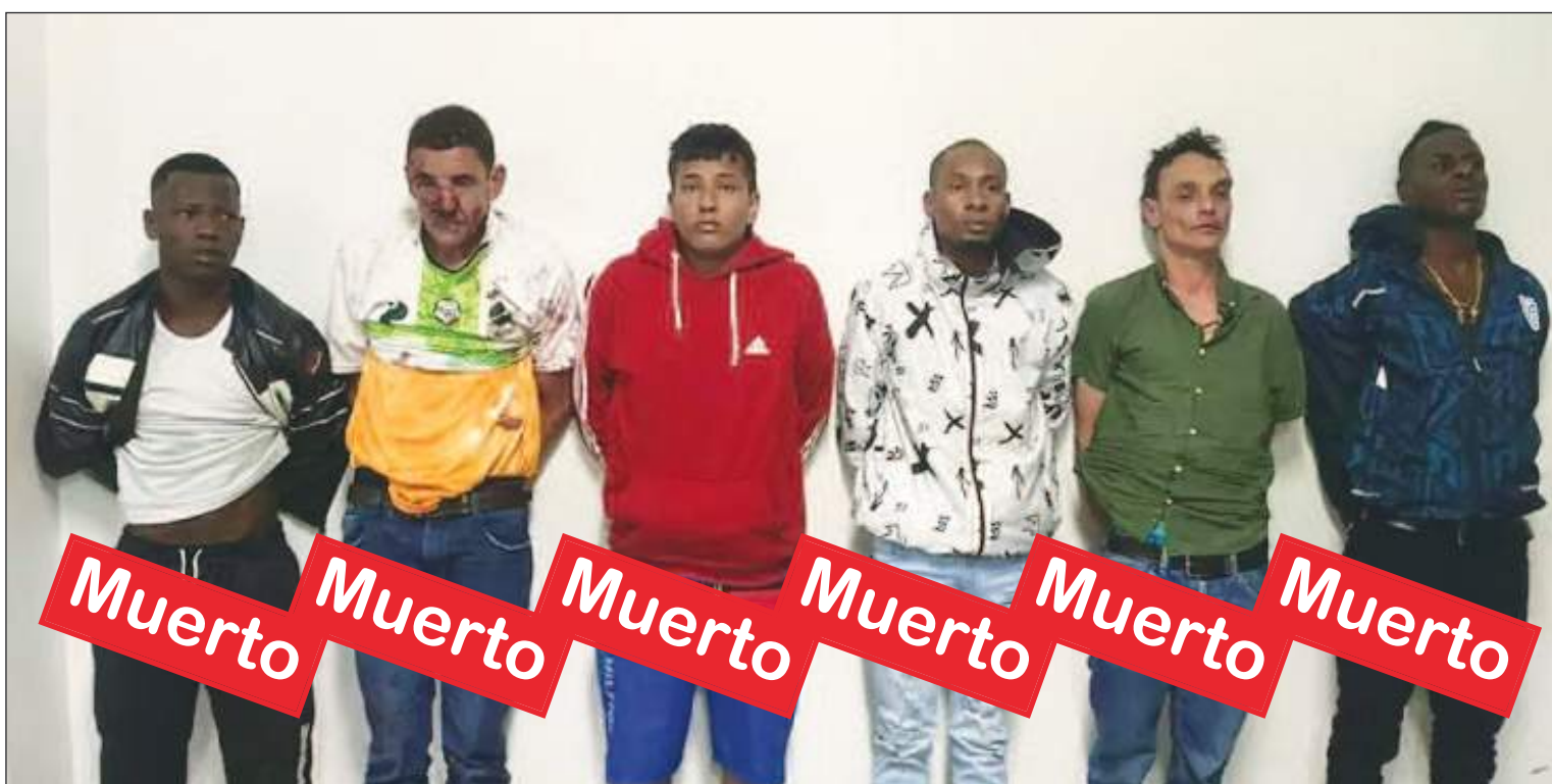
Los primeros 6 presuntos homicidas asesinados eran oriundos de la vecina Colombia, todos detenidos horas después del crimen de Villavicencio.

En principio no se proporcionaron detalles sobre la circunstancia en que se produjo el crimen. Tampoco se mencionó la nacionalidad de la víctima y sólo lo identificó como "José M." Sin