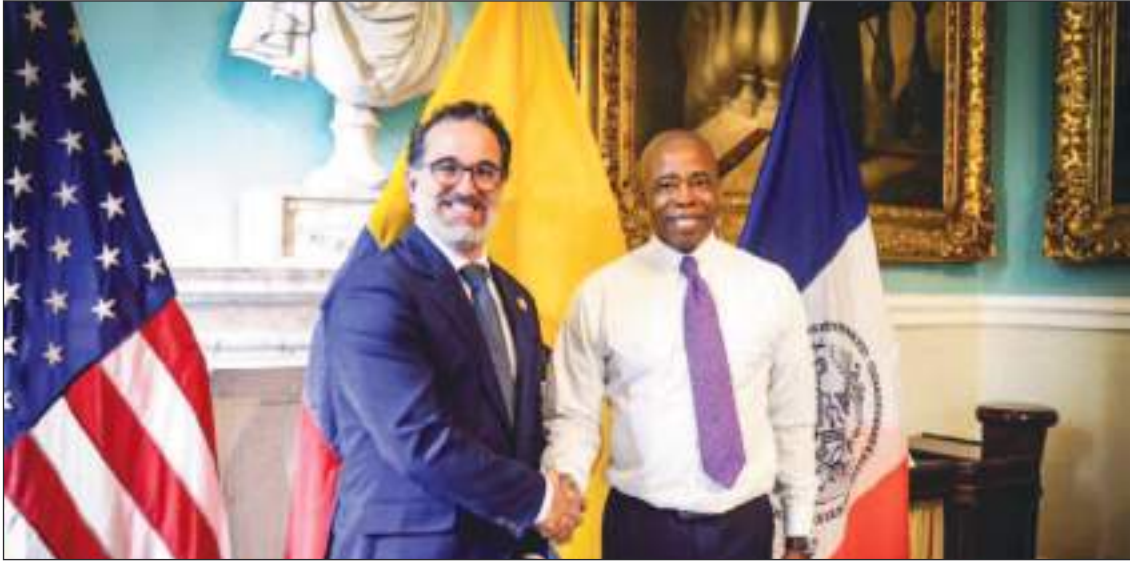
El Alcalde Eric Adams estuvo reunido con el Canciller ecuatoriano Gustavo Manrique.

a muchos solicitantes de asilo de América del Sur a América del Norte. El alcalde ya había pasado la primera etapa de su viaje en México, el cual se produce mientras el número diario de solicitantes de asilo que llegan a la Gran Manzana continúa aumentando. Su administración teme y se prepara para una afluencia potencialmente récord en las próximas semanas.