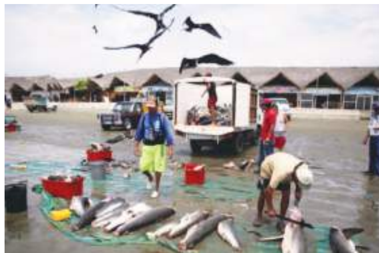
El fenómeno de El Niño está por llegar, pero uno de los sectores productivos que ya sienten sus efectos es el pesquero.

El fenómeno de El Niño está por llegar, pero uno de los sectores productivos que ya sienten sus efectos es el pesquero, debido al calentamiento de las aguas que produce que los peces se redistribi-