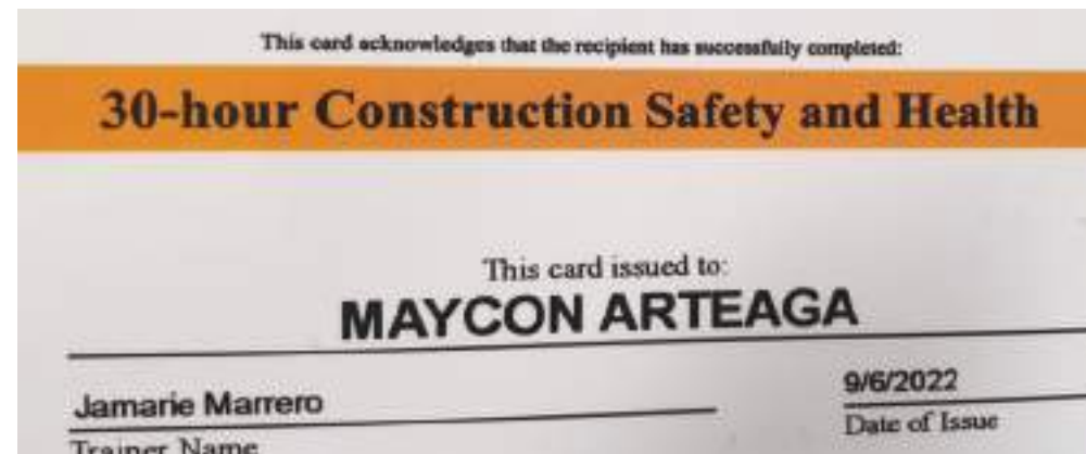
Las tarjetas de Osha Ud. las puede obtener sin problemas, en su idioma y al mejor precio, OSHA QUEENS, 100 - 05 ROOSEVELT AVENUE, 2DO PISO.

"OSHA QUEENS", No es simplemente una escuela de capacitación, es un centro de ayuda comunitaria para