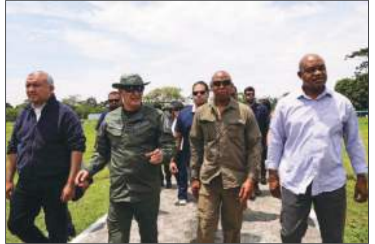
Adams estuvo en la localidad colombiana de Necoclí, donde se concentran los inmigrantes que quieren pasar el Tapón del Darien. Autoridades civiles y militares colombianas, lo acompañaron.

“No vamos a poder sostener la situación de los inmigrantes y solicitantes de asilo y de los neoyorquinos de larga data que también enfrentan problemas reales relacionados con la pobreza y las necesidades”.