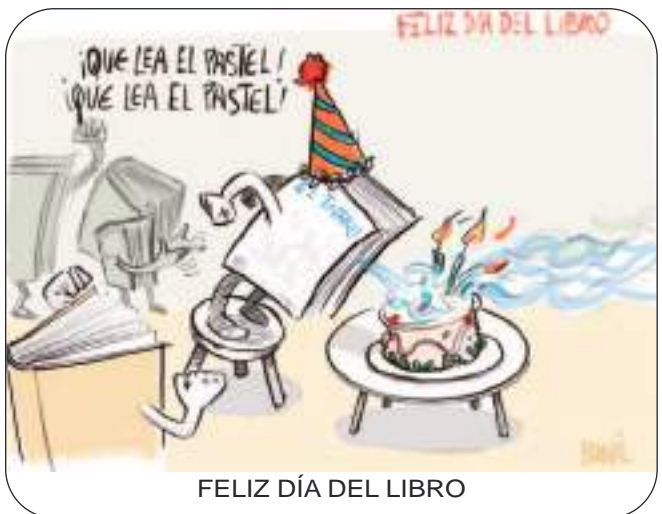
FELIZ DÍA DEL LIBRO