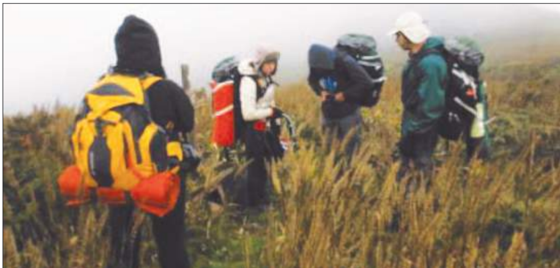
En el lugar muchos expertos siguen realizando importantes investigaciones.

y tamaño de esporas; y el molecular, para evaluar el ADN, es decir la huella digital, determinar el género y la especie.