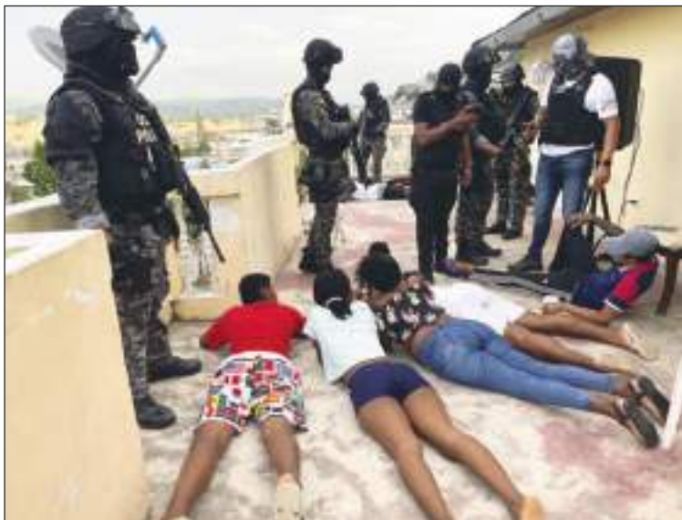
Todos son sospechosos y se les pide información sobre ellos.

"entre el tumulto de la gente normal", sin relaciones con la delincuencia, explica a la AFP el coronel de la policía Julio César Vásquez.