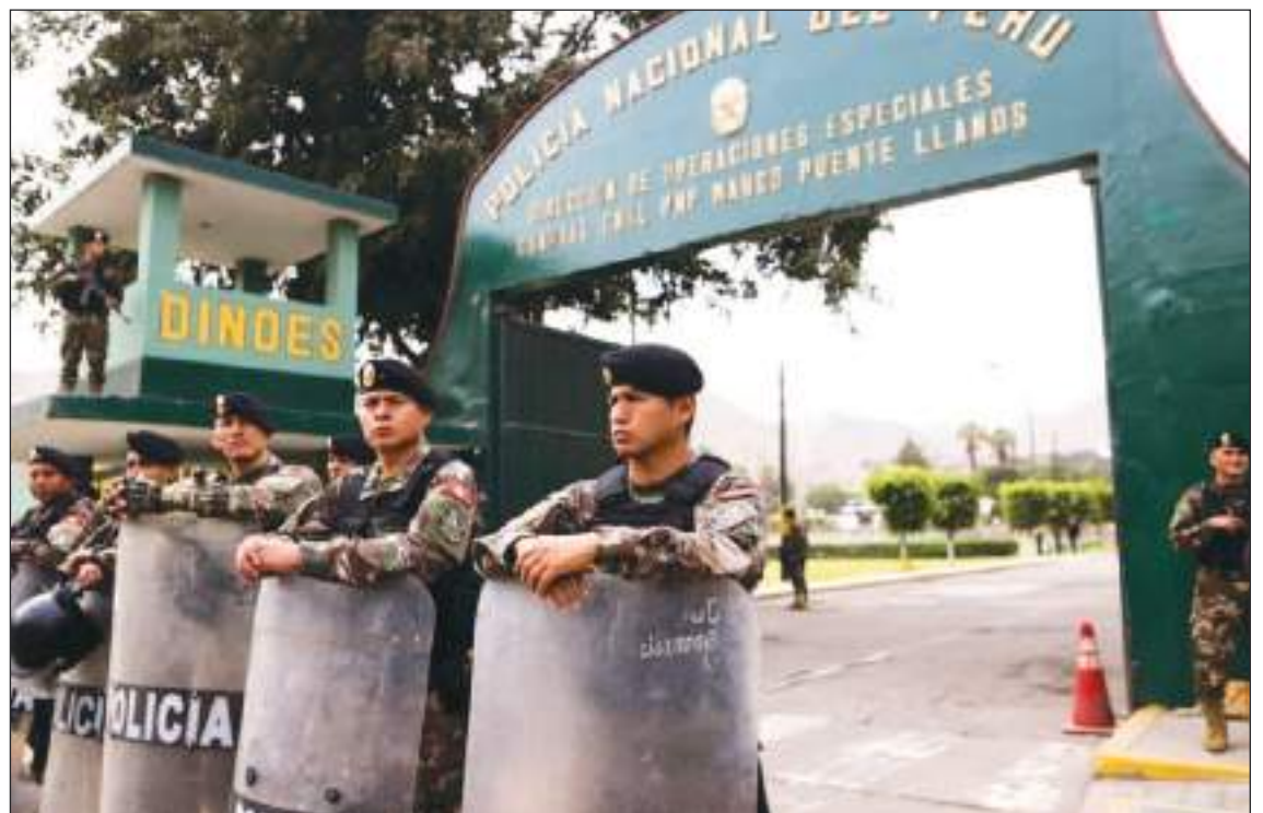
La policía, de guardia frente a la sede de Operaciones Especiales, en Lima, donde llegó Alejandro Toledo.

Además hay cargos contra Martín Vizcarra y, si Alan García no corrió igual suerte, fue porque se suicidó en 2019, cuando la Justicia lo tenía acorralado.