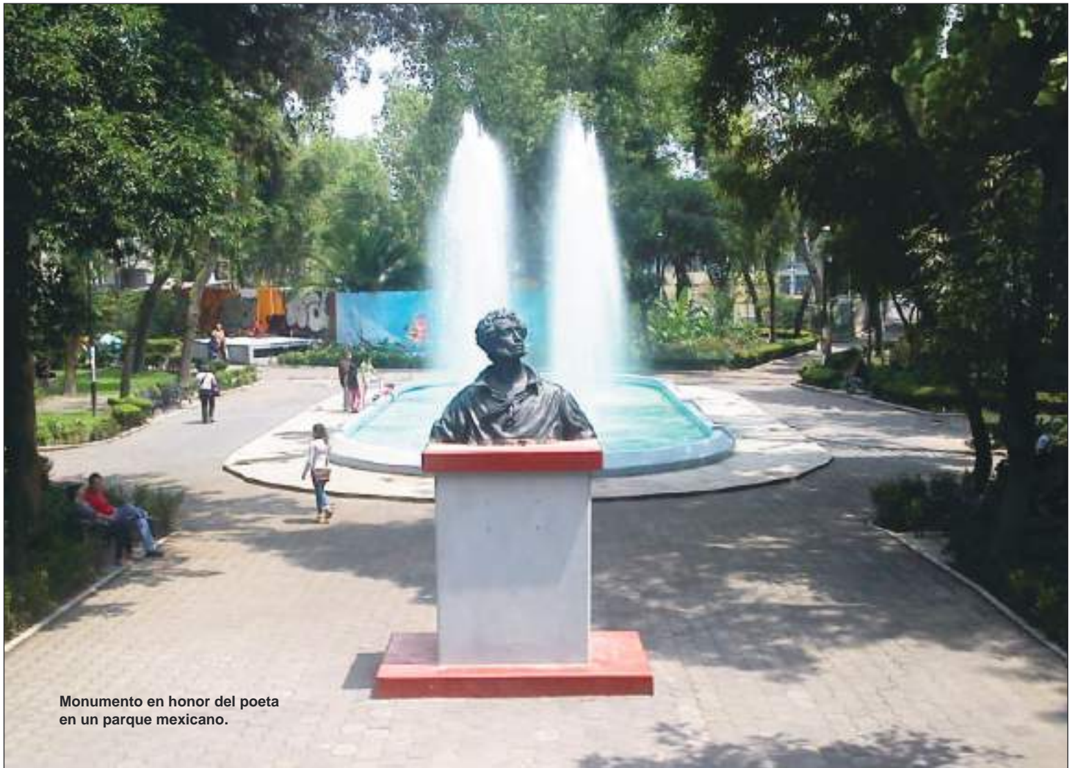
Monumento en honor del poeta en un parque mexicano.

Además, la Fundación está preparando la publicación del primer volumen de las obras completas de A. Pushkin completamente en español, que será una publicación única para América Latina. Pushkin se lee y se aprecia en toda su maravillosa sencillez, profundidad, musicalidad y rima en su idioma original, pero ciertamente nadie se ha atrevido a poner en castellano aunque fuere la más "opaca" de las versiones del gran poeta, que permitiera conocerlo y valorarlo, tal como ha sucedido en su país.