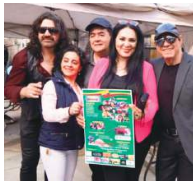
Un grupo de organizaciones Invitan a la gran cruzada solidaria por los Damnificados de Alausí, evento que se llevará a cabo el sábado 29 de abril. En el Flamboyán Manor ,147 Verona Ave. Newark, NJ.