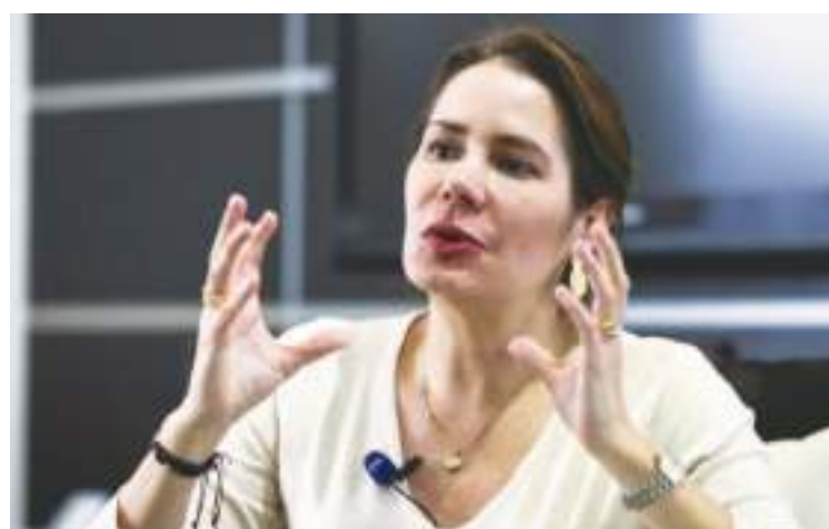
La ministra de Telecomunicaciones, Vianna Maino, solemnizó la llegada de Starlink a Ecuador. Un gran paso tecnológico.

Sobre todo se refirió a inversiones en infraestructura y a un nuevo marco normativo diseñado por el país para atraer capitales en telecomunicaciones.