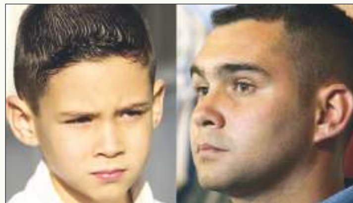
Mucho tiempo ha transcurrido desde aquel evento.

Tras el fracaso de las negociaciones entre las partes, las