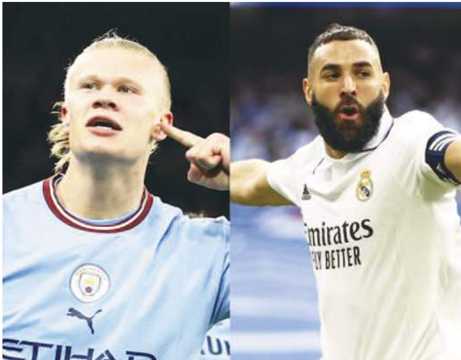
Erling Haaland (izquierda) del Manchester City y Karim Benzemá, del Real Madrid, puntales de dos equipos que juegan una auténtica final dentro de la semifinal.

Un video se esta haciendo viral en redes sociales sobre la inteligencia artificial prediciendo cual será el campeón de la Champions League. En TikTok, el usuario Nuovo Football subió un post en el cual la IA predice al AC Milán como el sorprendente campeón de esta competición.