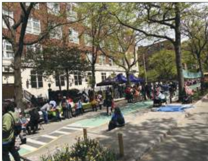
La avenida 34th recibió a niños, jóvenes y adultos para la celebración.

Las comunidades, especialmente como la nuestra han sido las primeras en enfrentar los efectos dañinos