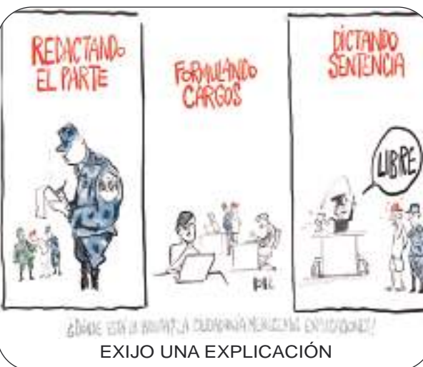
EXIJO UNA EXPLICACIÓN