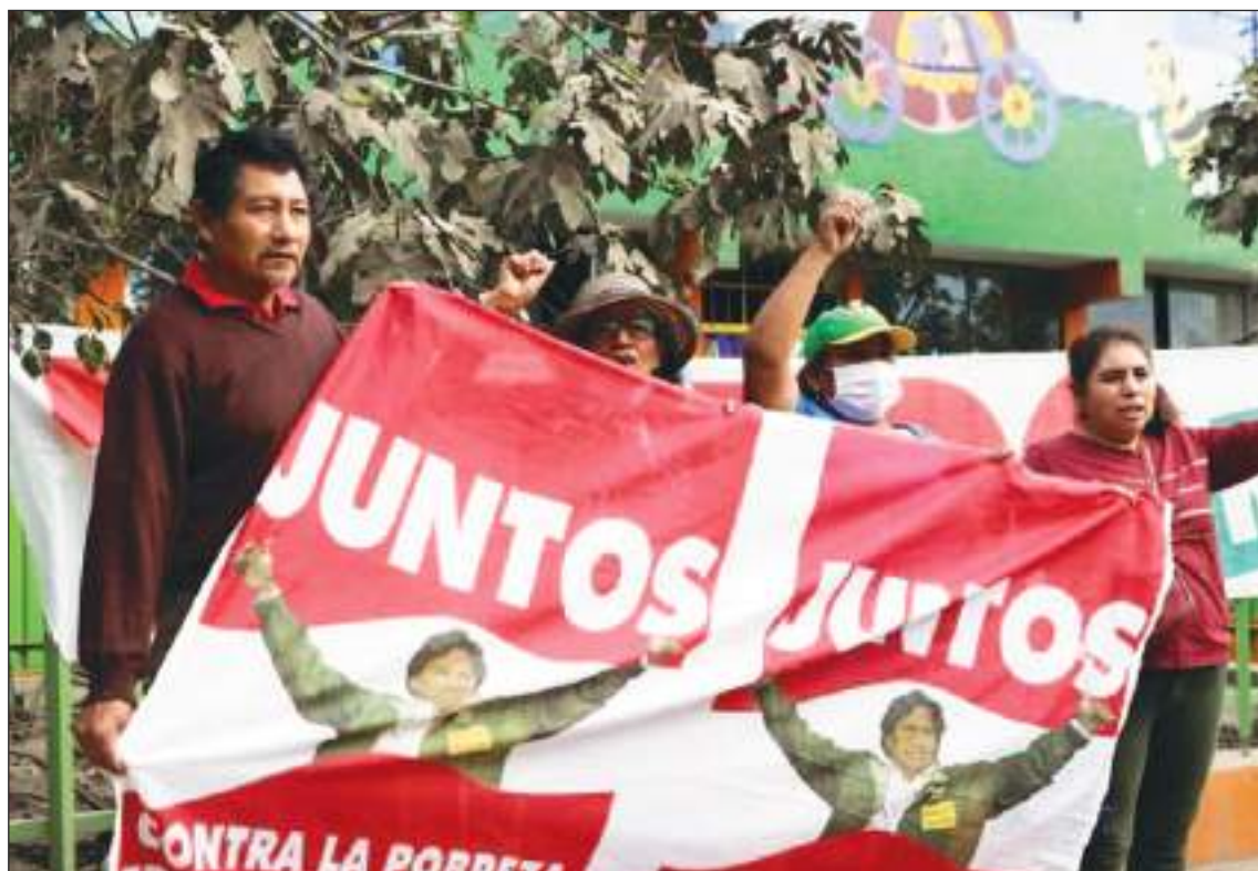
Seguidores de Alejandro Toledo se manifiestaron el domingo anterior en Lima, contra su encarcelamiento.

instalación policial del aeropuerto Jorge Chávez, donde se le notificó que queda privado de la libertad, pues está vigente una orden de prisión preventiva en su contra por 18 meses.