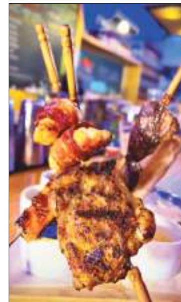
El churrasco brasileño, uno de los atractivos de Belo.

No te voy a mentir, es muy complicado a veces, él tiene sus ideas, yo las mías como ya las mencioné, además él es quien tiene más conocimiento de todo un restaurante desde el piso hasta arriba, y cuando yo saco a la luz mis ideas para darle un cambio en bienestar del mismo, ahí es cuando chocamos, pero al final del