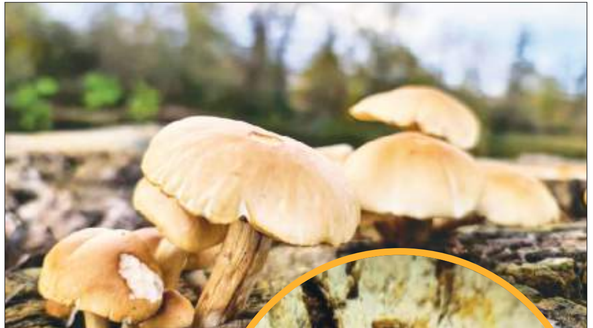
Lo del hongo antibacterial ha sido un importante descubrimiento en Ecuador. A la derecha lo vemos a través del microscopio

este levantamiento se sometieron a diversos procesos: el morfológico, que permite describir las características básicas como color