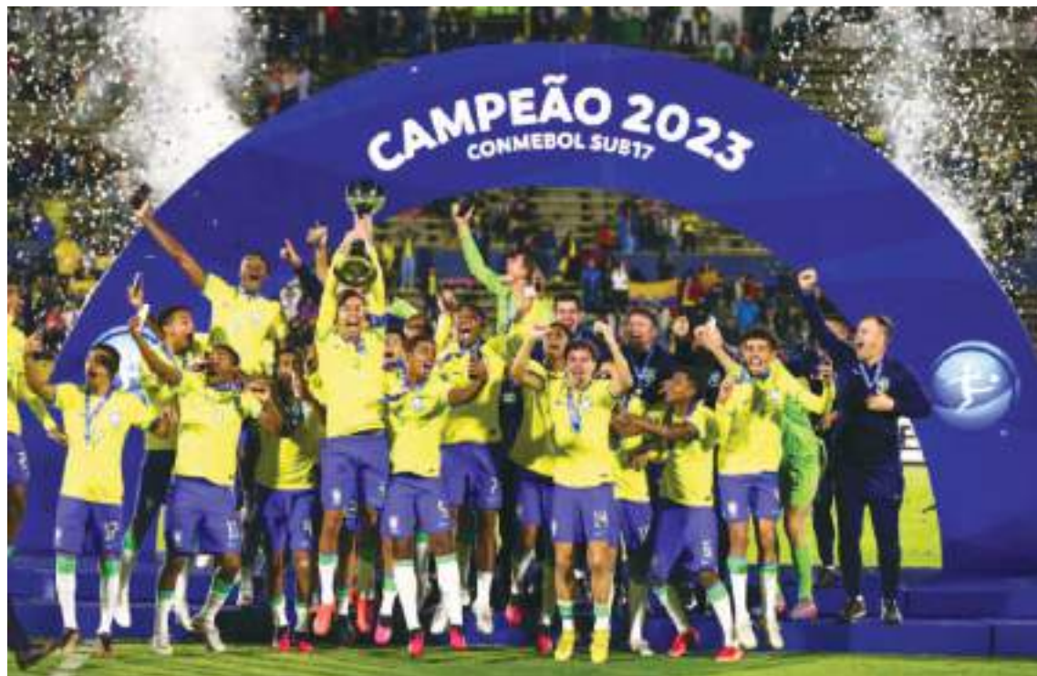
Los jugadores de Brasil celebran tras coronarse campeones del campeonato Sudamericano Sub-17, en el estadio Olímpico Atahualpa de Quito (Ecuador)