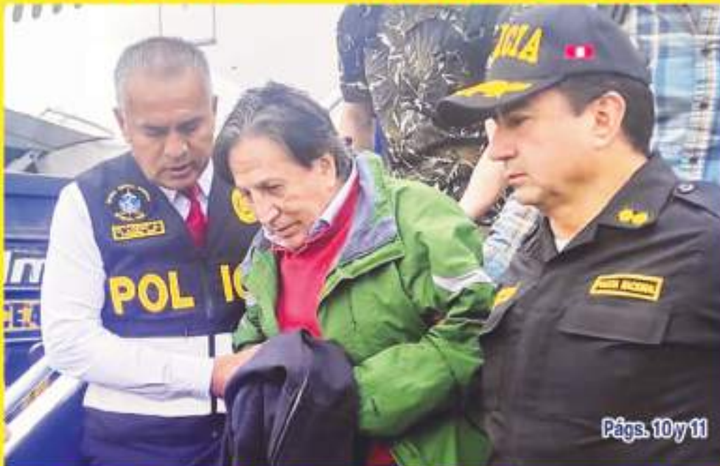
Págs. 10 y 11