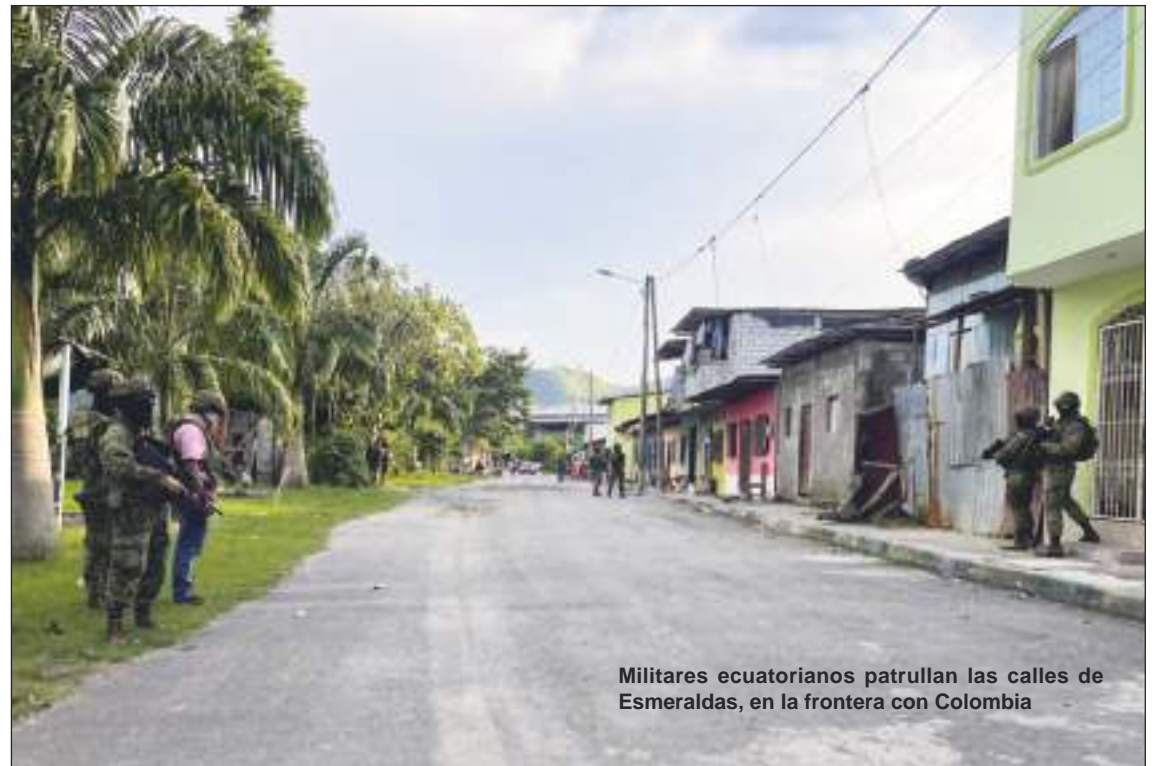
Militares ecuatorianos patrullan las calles de Esmeraldas, en la frontera con Colombia