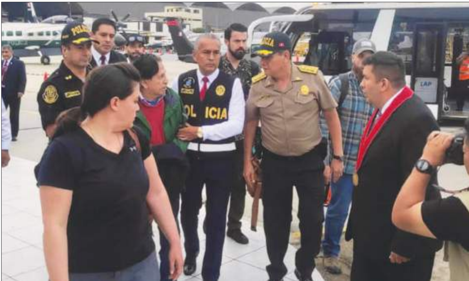
El expresidente Alejandro Toledo fue tratado con mucho respeto por quienes tiempo atrás fueron sus subalternos.