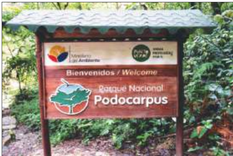
Ingreso al parque donde se hizo el descubrimiento.

este levantamiento se sometieron a diversos procesos: el morfológico, que permite describir las características básicas como color