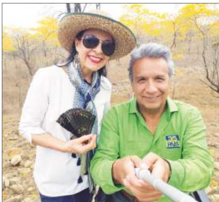
Lenin Moreno y su esposa en épocas menos complicadas.

El caso ‘Ina Papers’ estalló en 2019, cuando se conocieron supuestas irregularidades relacionadas con empresas ‘offshore’ y con personas del entorno cercano de Moreno, entonces presidente del país y quien en aquel momento ya negó su participación en la presunta trama de corrupción.