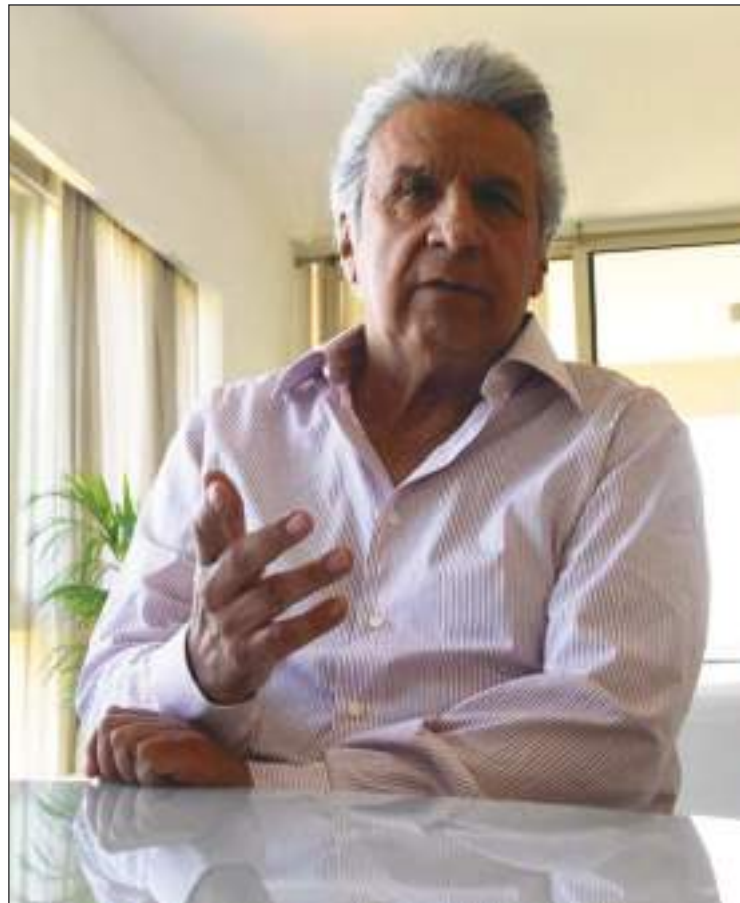
Lenin Moreno ha descartado asilarse en Paraguay donde se encuentra.

La petición de la Fiscalía fue refutada por la defensa del expre-