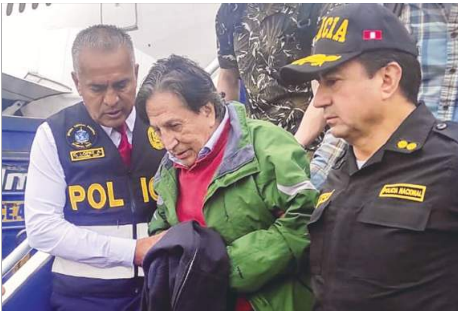
En esta foto difundida por la Policía Nacional de Perú, agentes escoltan al expresidente Alejandro Toledo a su llegada, extraditado desde Estados Unidos, al aeropuerto de Lima, el domingo 23 de abril de 2023.

En un primer paso judicial, el ex mandatario fue llevado a una