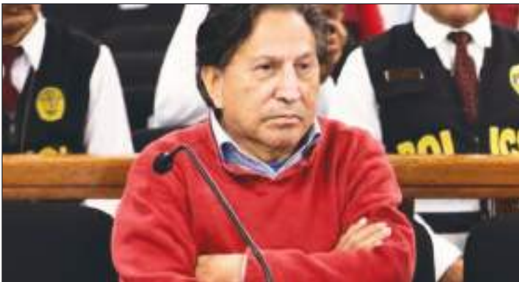
Hijo de un albañil y de una lavandera de ropas, Alejandro Toledo nació en el pequeño poblado quechua de Cabana, en los Andes norteños, y creció en la ciudad de Chimbote, donde sobrevivió como lustrabotas o vendedor ambulante de pescado.