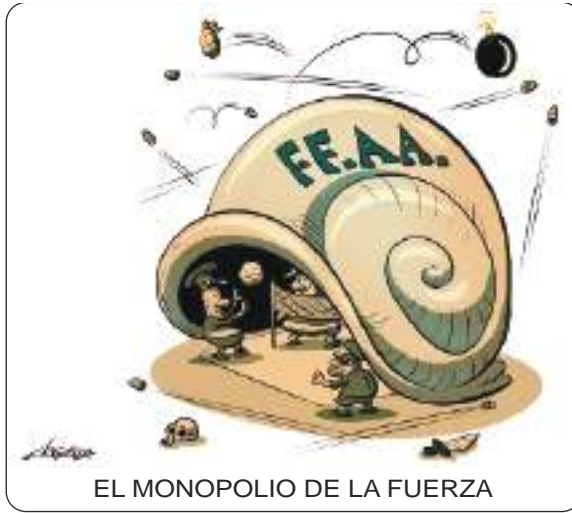
EL MONOPOLIO DE LA FUERZA