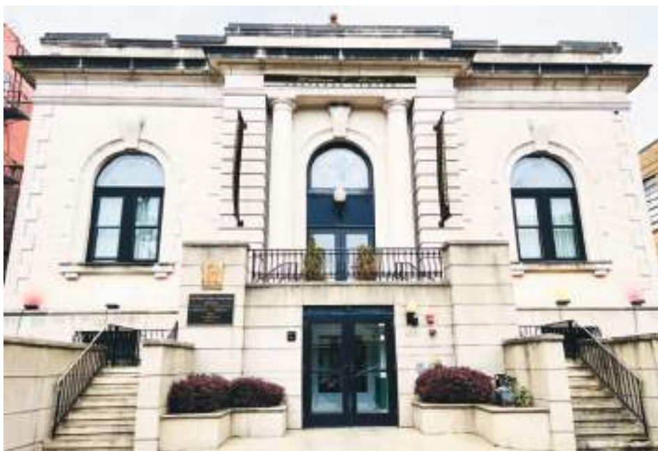
Este martes 25 de abril se llevó a cabo la entrega de premios a quienes se han destacado en el deporte, local William V. Musto Cultural Center de Union City.

las calles de la ciudad, y otros aspectos beneficien a los residentes de West New York que en gran parte son de origen hispano; Cirillo se identifica en la columna A.