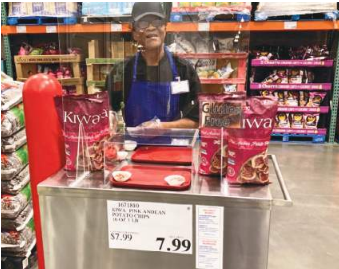
Pink Andean Potato Chips ya están en Costco Wholesale de New York y otros estados.

El producto es muy rico, son las papas naturales, con ese color especial, hecha con aceite de palma que la hace más rica y es mucho mejor