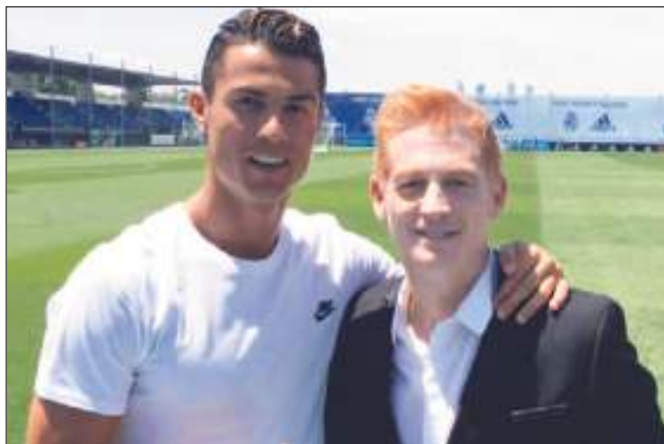
A sus paisanos y a Bucaram les desagrada que el periodista sea admirador y amigo de Cristiano Ronaldo.