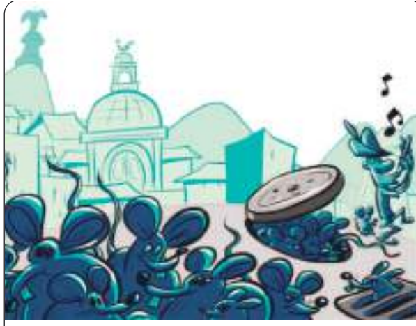
NO ES HAMELIN, ES QUITO