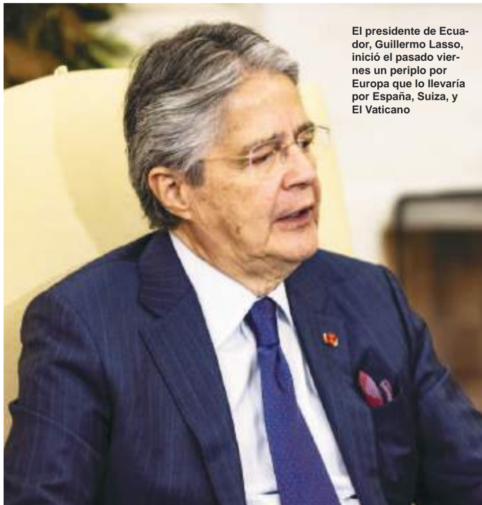
El presidente de Ecuador, Guillermo Lasso, inició el pasado viernes un periplo por Europa que lo llevaría por España, Suiza, y El Vaticano

Lasso destacó, sobre todo, la reunión con la Segib, que dirige el chileno Andrés