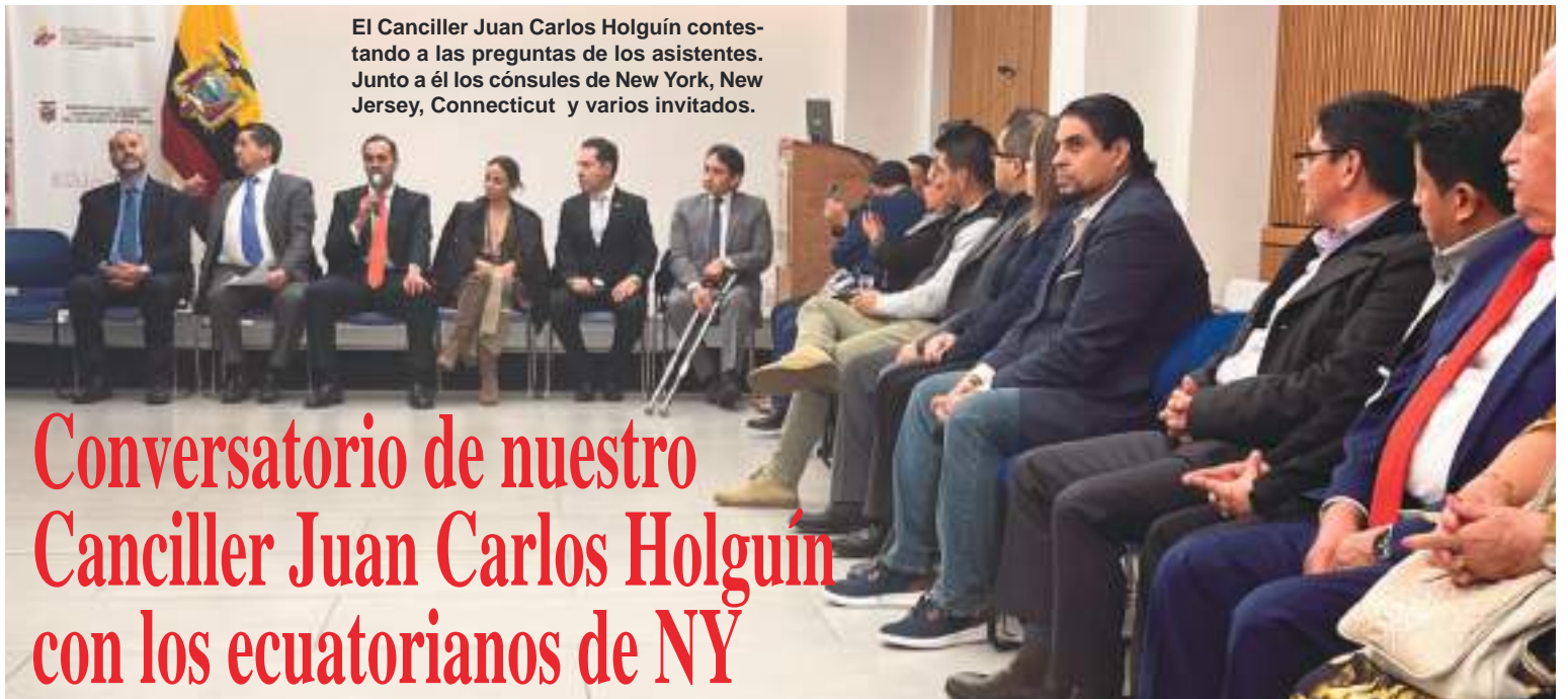
El Canciller Juan Carlos Holguín contestando a las preguntas de los asistentes. Junto a él los cónsules de New York, New Jersey, Connecticut y varios invitados.