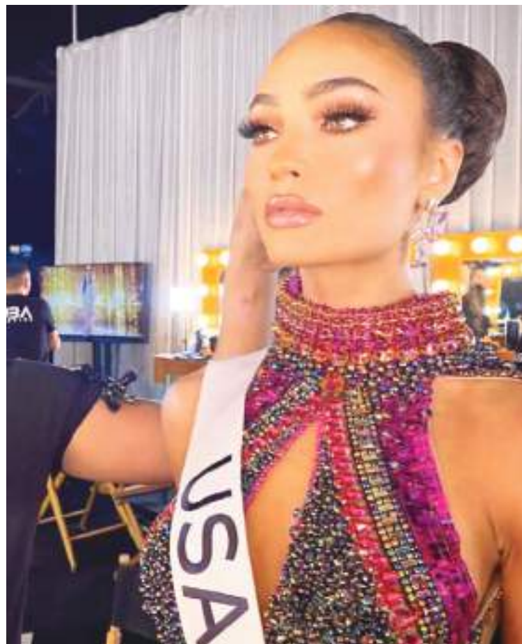
La nueva Miss Universe 2022 R'Bonney Gabriel en camerinos se preparaba a salir al concurso.

Una de las que no se hizo esperar fue la periodista y presentadora María Celeste Arrarás, quien estuvo en total desacuerdo con la nueva ganadora y dijo "Porque estoy en desacuerdo con la elección de Miss USA como Miss Universe 2022.