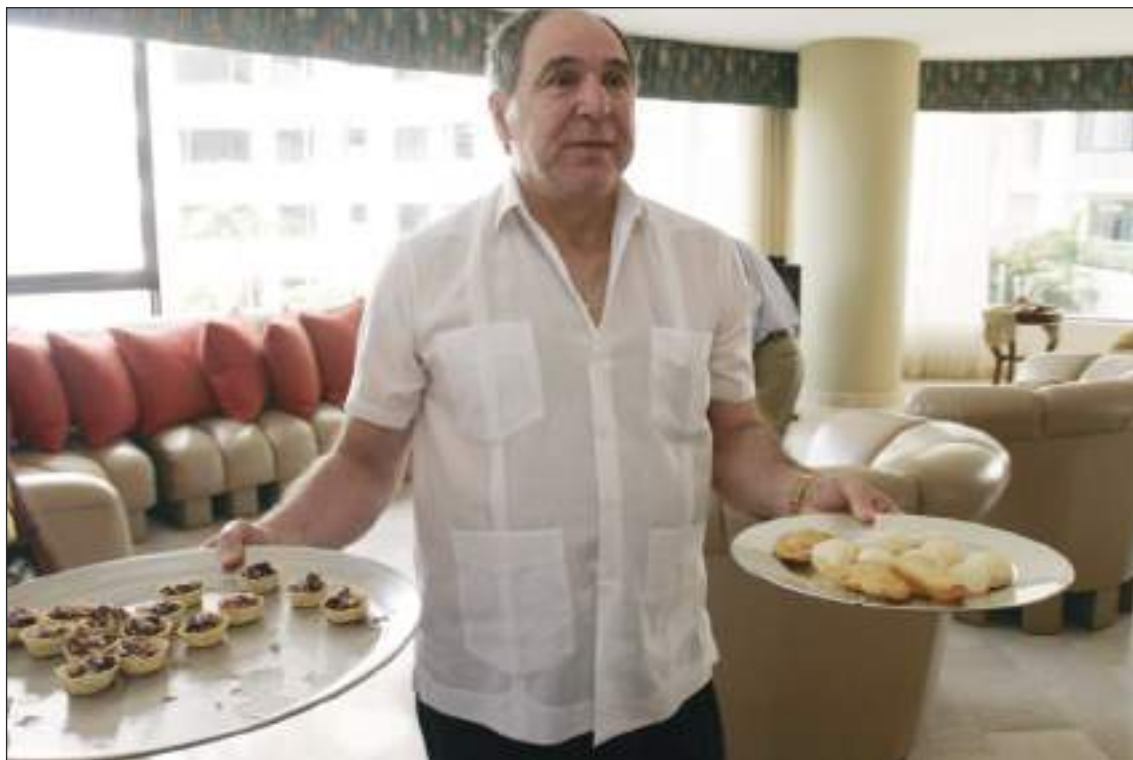
Abdalá Bucaram tiene la virtud de nunca pasar desapercibido.

medias tintas para verter sus opiniones. El “pelirrojo” se gana entonces enemigos de toda índole, por ejemplo los seguidores de Lionel Messi, a quien ha criticado cuando sus actuaciones no han sido buenas. Lo ha hecho en buenos términos, pero aún así, en el deporte se generan pasiones tan terribles y extremas, que es un “pecado” mencionar algo que no le favorezca al ídolo.