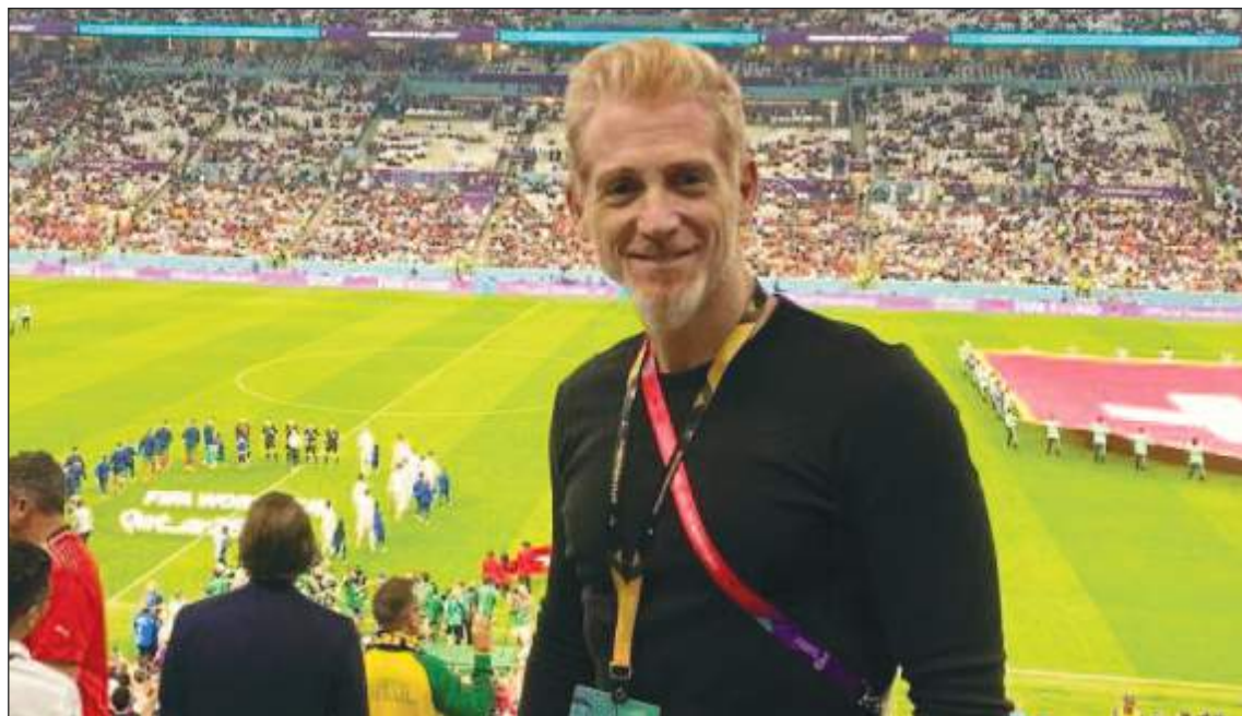
Martín Liberman en el reciente mundial de Qatar.