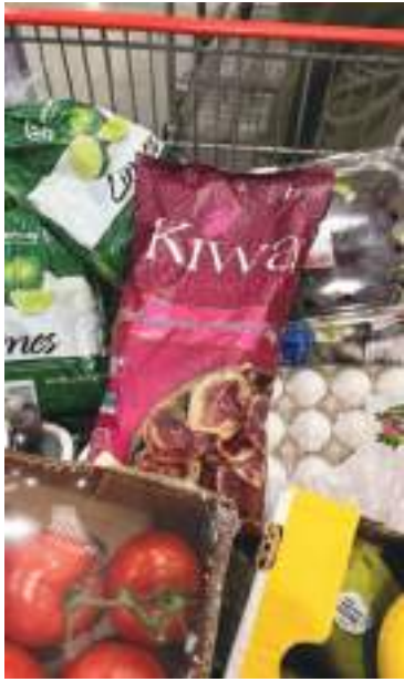
Los productos de KIWA han tenido una gran aceptación en el mercado anglosajón.

comparado con otros aceites que existen, como el aceite a base de girasol y otros que existen en los Estados Unidos de América.