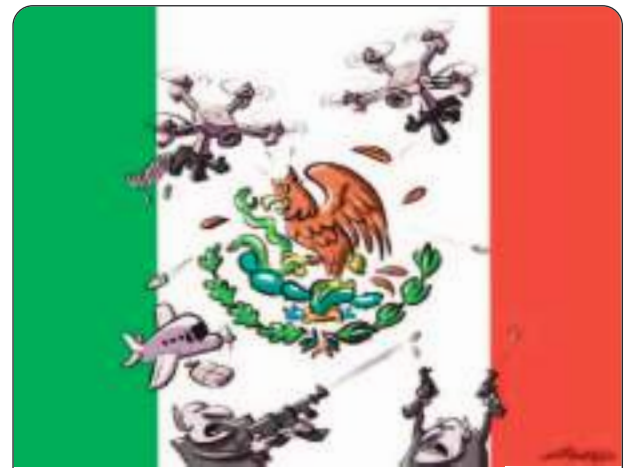
LA TIERRA DEL OLVIDO