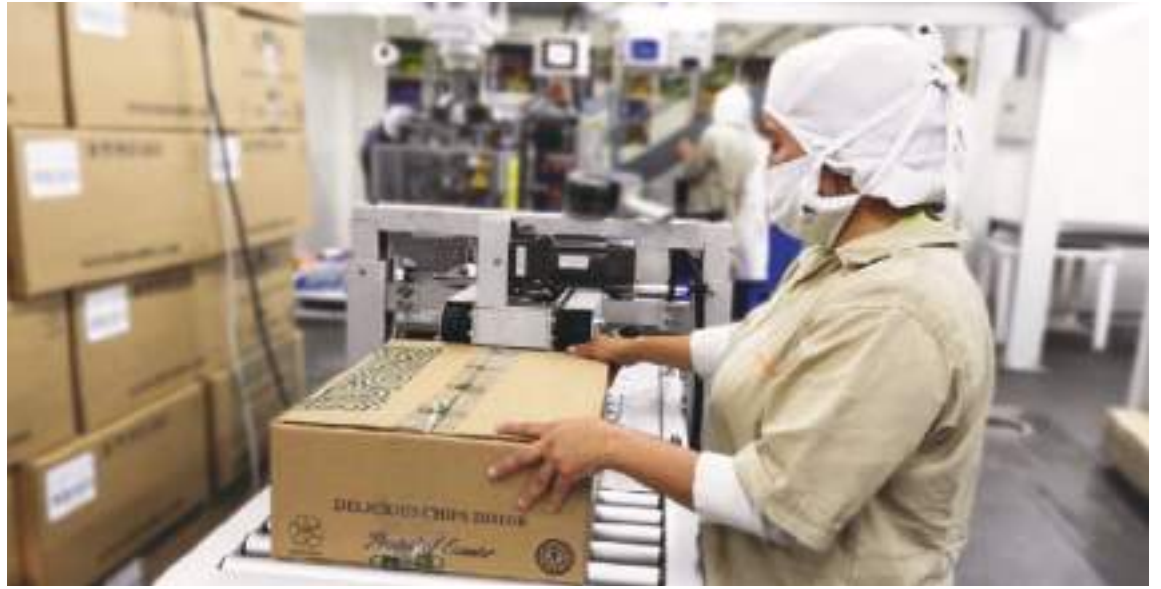
1Las instalaciones de las fábricas de KIWA Life cuentan con todas las medidas de salubridad, protección y seguridad para todos quienes forman parte de la misma.

A la gente que no conoce nuestro producto, siempre tenemos promociones en nuestra página web, hay cómo comprar en Amazon y KIWA Life.com , y en Costco tenemos frecuentemente varias degustaciones para toda la gente, felizmente cuando las personas lo prueban ellos quieren