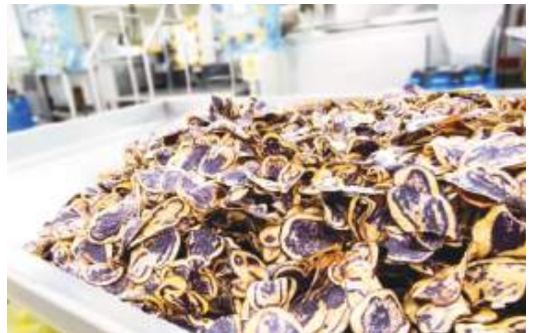
La papa Yana Shungo la cual es utilizada como uno de los principales ingredientes de los Snacks de KIWA.