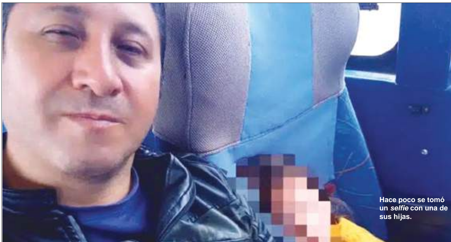
Hace poco se tomó un selfie con una de sus hijas.