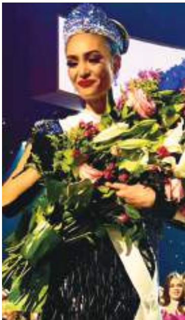
Ya coronada como la nueva Miss Universe 2022 R'Bonney Gabriel .

La Miss Universe 2021 Harnaaz Sandhu, de la India, subió al escenario para realizar su desfile final; con emotivas palabras agradeció por su reinado. Minutos antes de anunciar a la ganadora la Organización Miss Universe reveló que El Salvador será la próxima sede