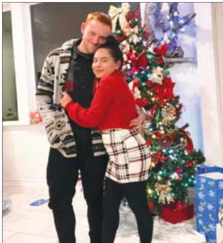
Todo parecía bien en la pareja. Celebraron la navidad felices.

su madre en su país; y se acababa de mudar al condado de Waller.