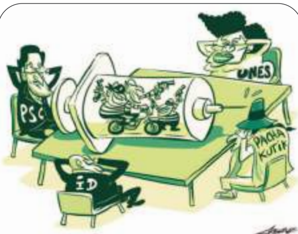
VACUNAS PARA EL PUEBLO