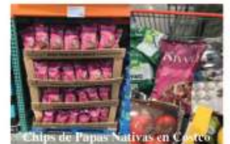
Chips de Papas Nativas en Costco

Así nacen las Pink Andean Potato Chips , un snack único, de sabor ancestral y cultivado regenerativamente, que ingresó a COSTCO WHOLESALE a inicios de 2023.